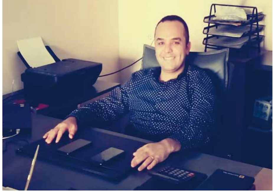
Fatih KARA GAYRİMENKUL VE AUTO

Ulusal egemenlik, ulusun namusudur, onurudur, şerefidir. 23 Nisan Ulusal Egemenlik Ve Çocuk Bayramı kutlu olsun